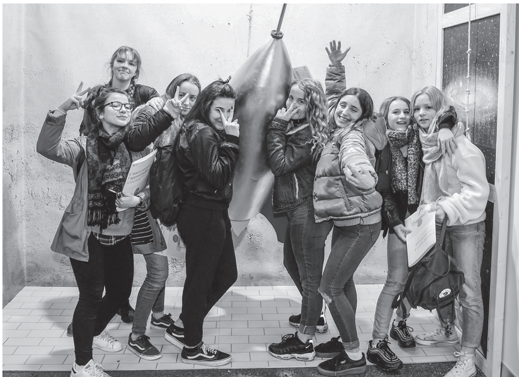
Il y a déjà foule sur la rampe de lancement de l'édition 2020 du Salon!

stratégique. Cela traduit clairement la volonté d'intégration du Salon au GIP pour le développement de synergies et de prestations en faveur de l'orientation et de la formation professionnelle.